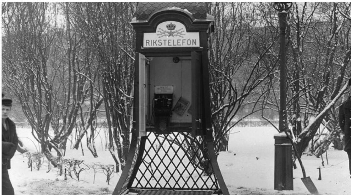
Stockholms första telefonkiosk som uppsattes i Kungsträdgården i mars 1901.

I början av 1900-talet började telefonkiosker sättas upp runt om i Sverige. Även de som inte hade telefon hemma kunde ringa ett samtal. Idag är telefonkioskerna sällsynta.